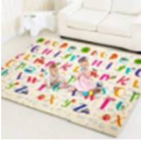
Görsel 1 Görsel 2